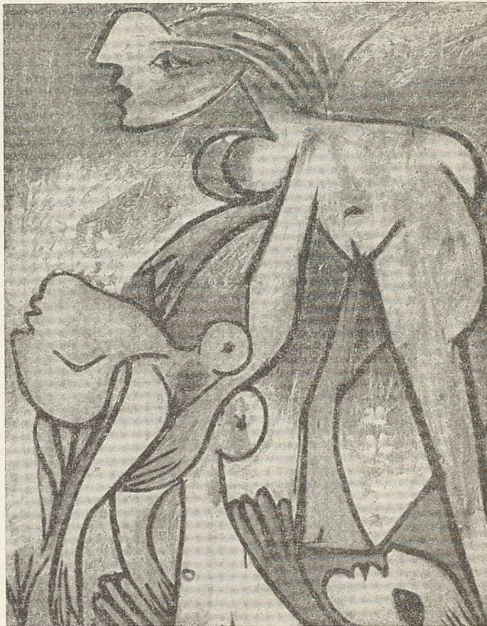
Picasso: El Salvament , 1932.